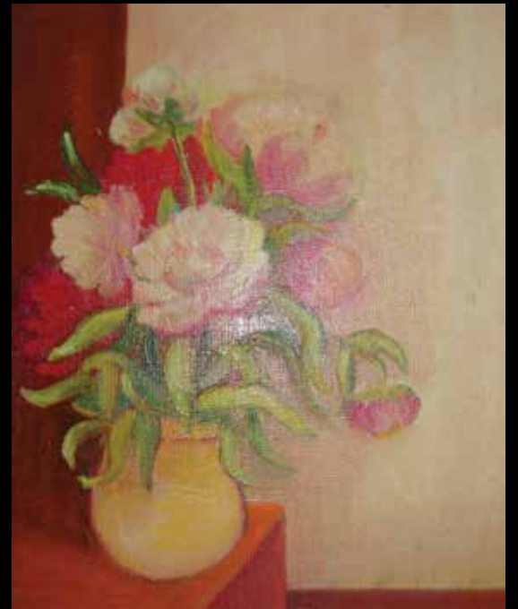
Olej na płótnie