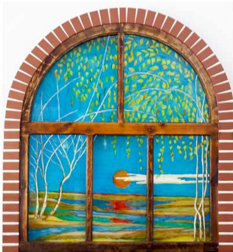
Malarstwo na szkle. Okna dekoracyjne (ok. 160 cm x 200 cm).