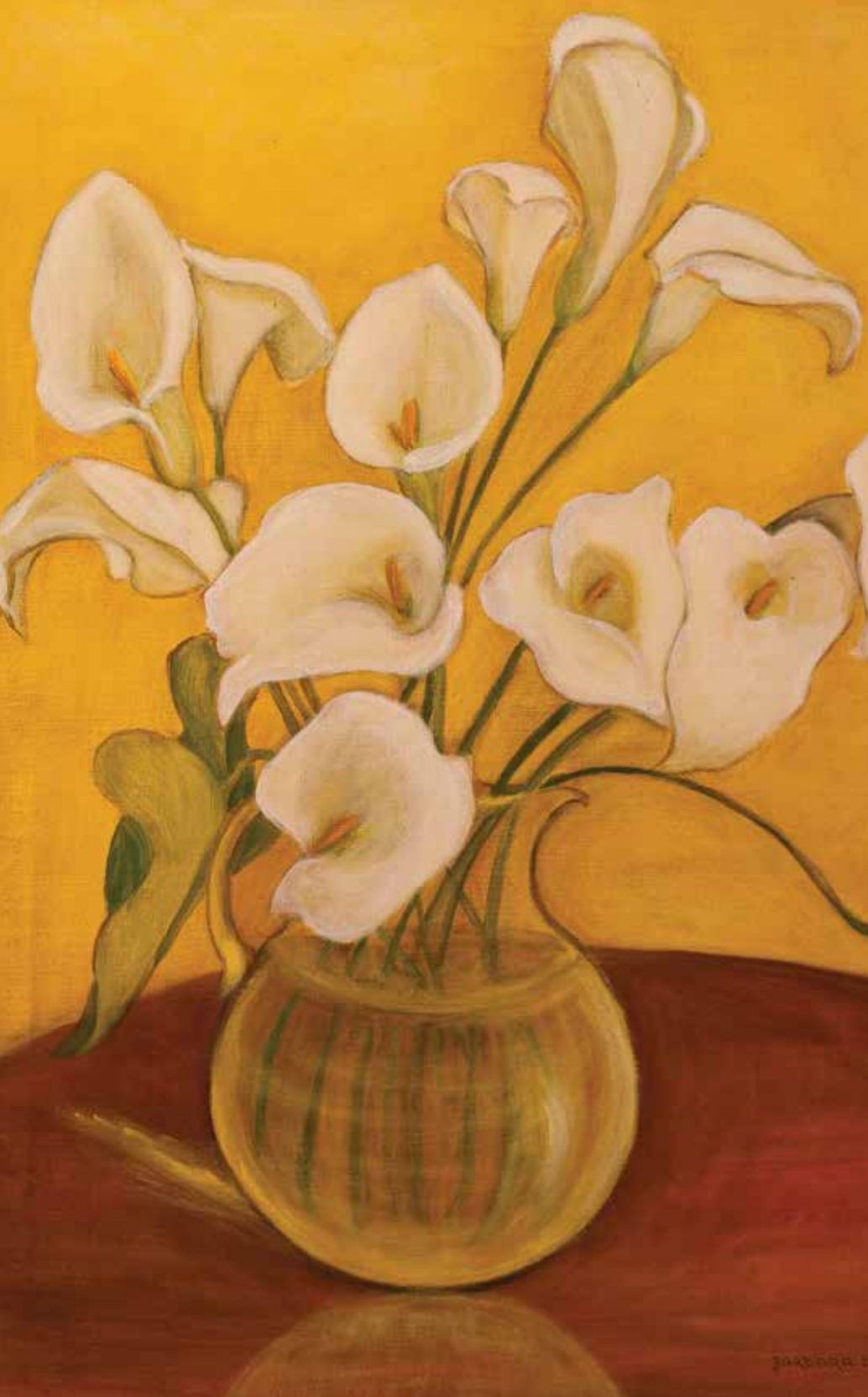
Olej na płótnie