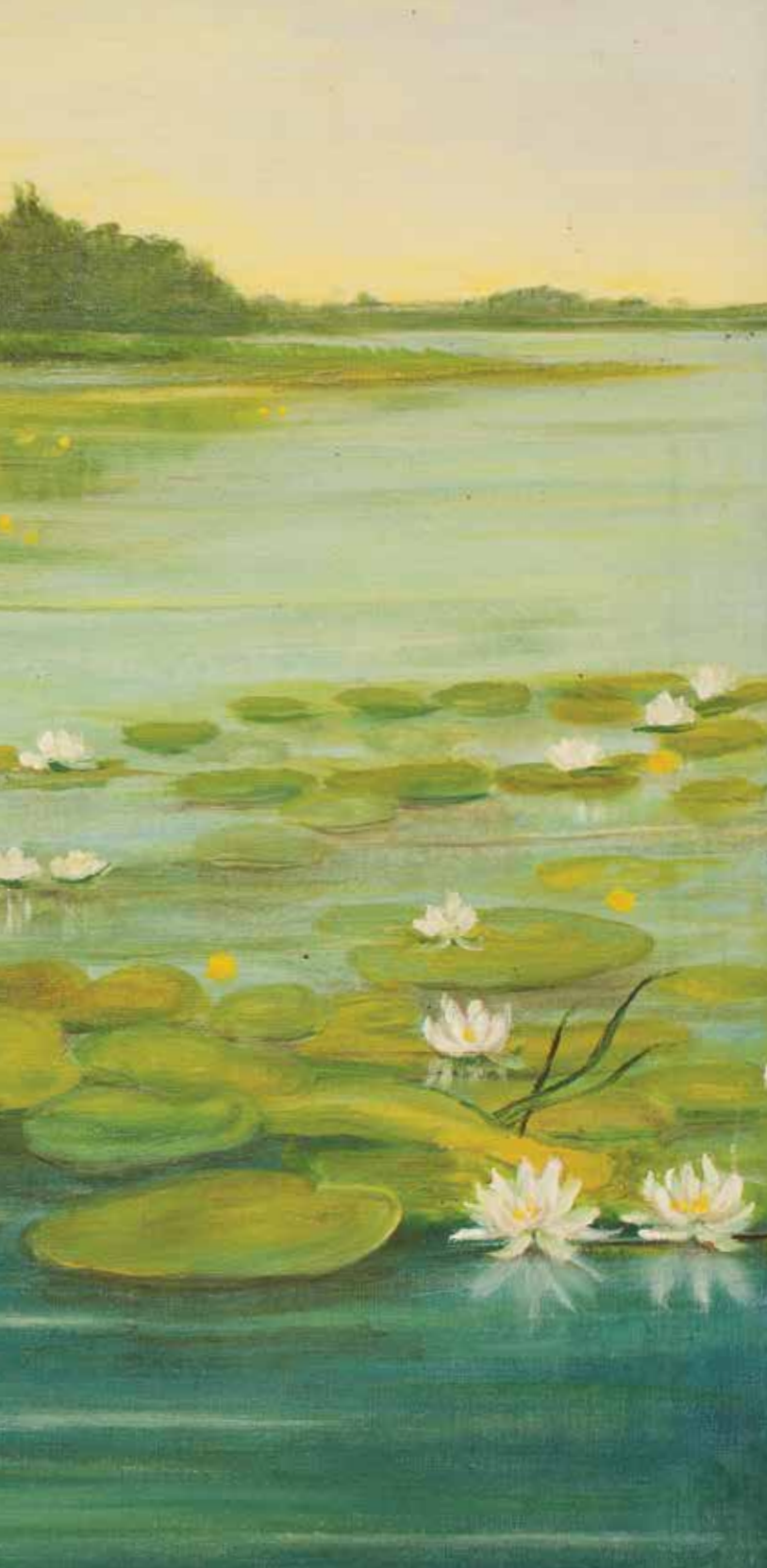
Olej na płótnie