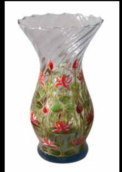
Malarstwo na szkle