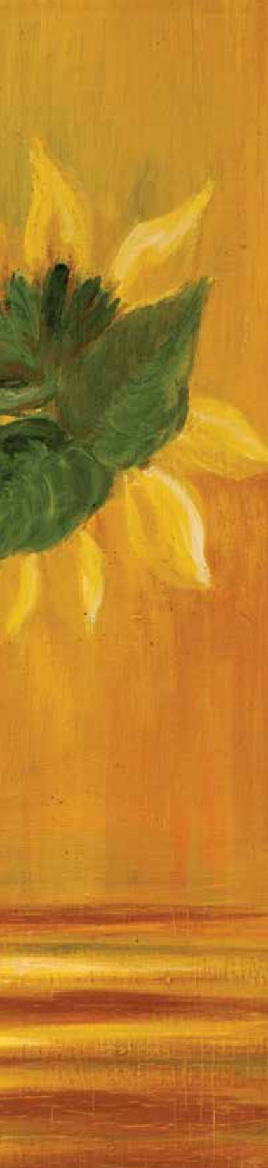
Olej na płótnie