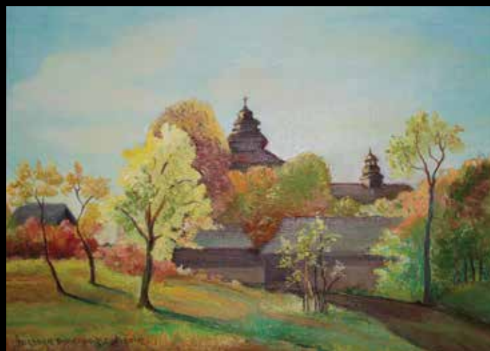
Olej na płótnie