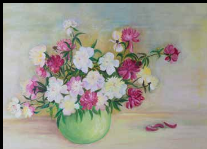
Olej na płótnie