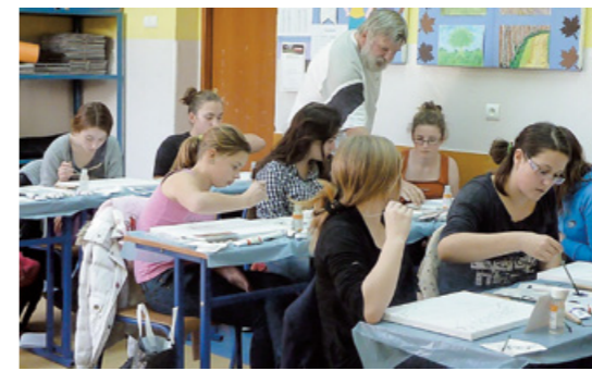
Impast w szkole

plastycznych. Pierwszą techniką, z jaką zapoznaje się młodzież gimnazjalna jest impast – malarstwo szpachelkowe farbami olejnymi.